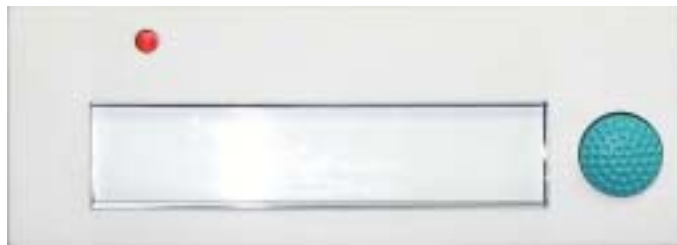
Abb. in Originalgröße

Vibrationsfolge: Ein Tastendruck löst bei MV-Empfängern die folgende Vibrations- bzw. Blitzfolge aus: * * * * * (8 x lang)